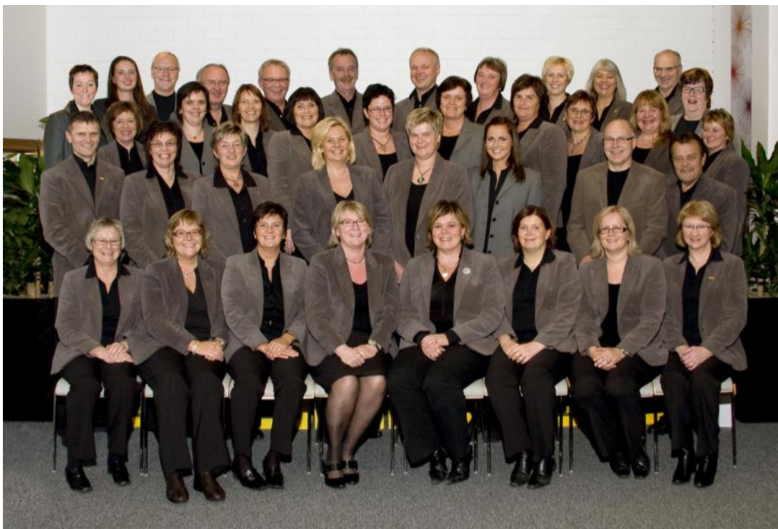
Klar til innsats—alle ansatte i Selbu Sparebank